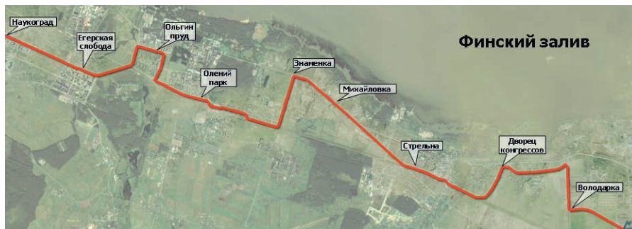
Рис. 1. План участок трассы «Надземного экспресса» на Петродворец

Для решения вышеупомянутых задач были использованы современные немецкие программные комплексы CARD/1 и KorridorFin. В проектную деятельность ЗАО «Петербургские дороги» данные продукты были внедрены специалистами